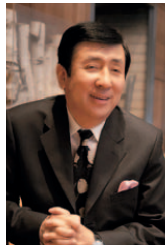
慶應義塾大学大学院 システムデザイン・ マネジメント研究科 教授